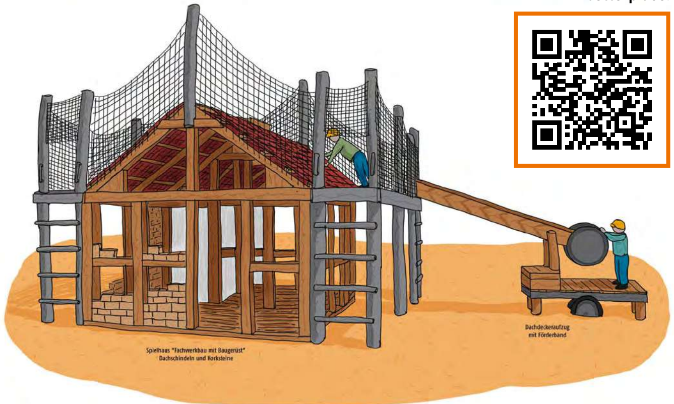
Spielhaus "Fachwerkbau mit Baugerüst" Dachschindeln und Korksteine